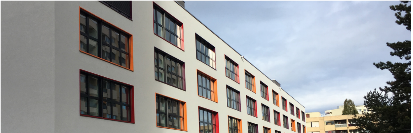
Meyrin, Promenade des Artisans (GE)