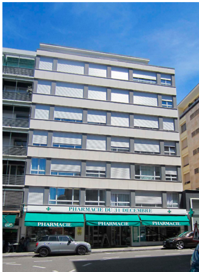
Rue 31 Décembre 43

Au 31.03.2024, l'immeuble affiche une valeur de marché de CHF 14.66 millions pour un prix de revient de CHF 10.21 millions et un état locatif de CHF 0.50 millions. La réserve locative de cet immeuble est estimée à environ 24%.