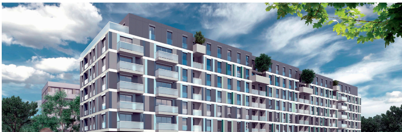
Meyrin, Vergers (GE)