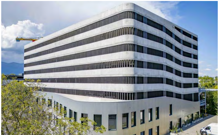
Rue des Ateliers 4 à Meyrin (GE)

Acquis pour CHF 24 millions, l'immeuble présente un rendement brut d'environ 4.9% et s'inscrit dans une stratégie core offrant des revenus sécurisés à long terme.